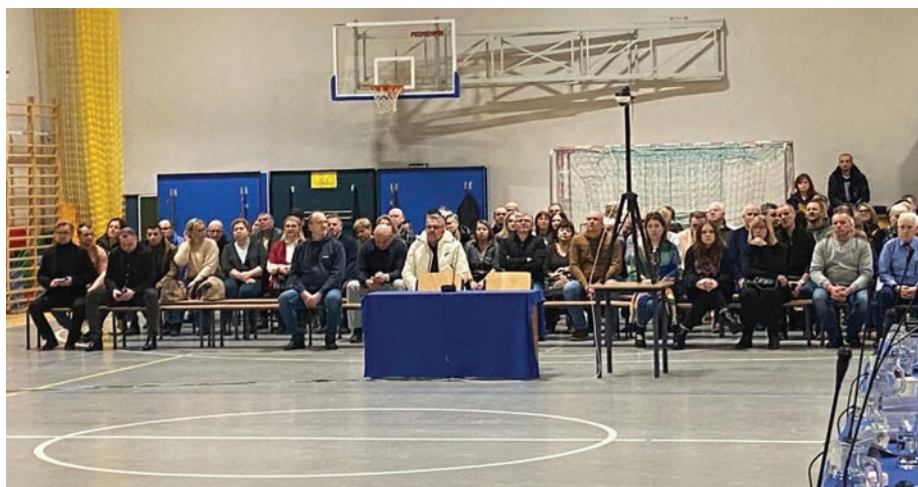
// Liczna grupa mieszkańców podczas wspólnej sesji Rady Miasta Otwocka i Rady Gminy Wiązowna, która odbyła w szkole w Gliniance.

Już listopadzie 2024 r., czyli ponad rok temu, Rada Gminy Wiązowna podjęła uchwałę intencyjną w sprawie przystąpienia do sporządzenia planu, wskazując w uzasadnieniu, że miejscowy plan określi, co będzie dozwolone na tym terenie, „biorąc w szczególności pod uwagę obecne negatywne skutki wynikające z gromadzenia i przetwarzania odpadów na terenach objętych planem”, a także pozwoli, „uniknąć niekontrolowanego rozszerzania funkcji związanych ze składowaniem odpadów”, co mogłoby umożliwić wydanie w tym zakresie decyzji o warunkach zabudowy.