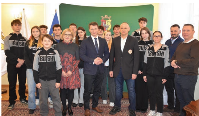
// Klub Sportów Walki BUSHI razem z prezydentem i radnymi.