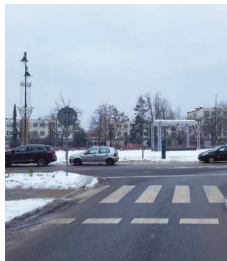
// Na skrzyżowaniu ul. Karczewskiej z ul. Powstańców Warszawy powstanie lewoskręt.

Inwestycje drogowe w Otwocku, zaplanowane do realizacji przez powiat przy pomocy finansowej miasta, mają zostać wykonane w tym roku (patrz ramka). ■