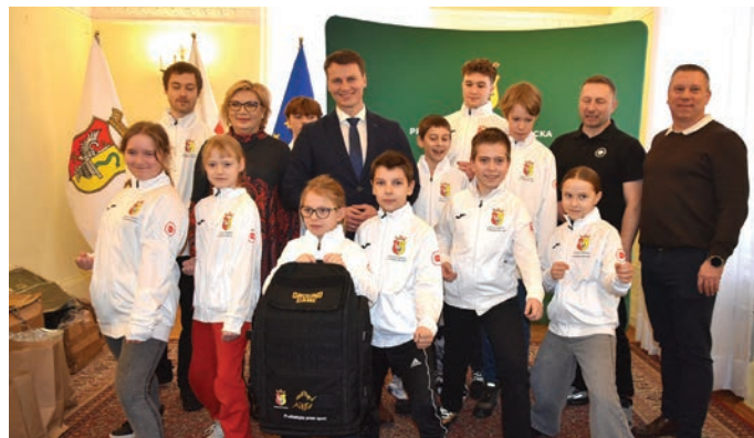
// Klub Sportowy Sokudo Karate WKF Otwock razem z prezydentem i radnymi.