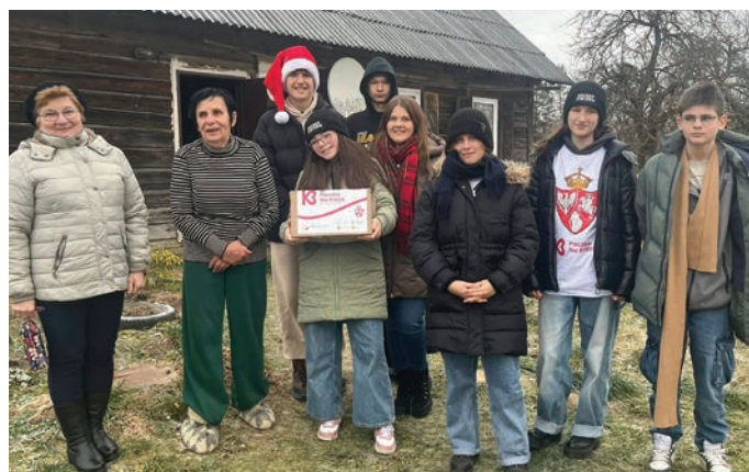
// Wolontariusze „Paczki na Kresy” z SP nr 4 w odwiedzinach u Polaków mieszkających na Łotwie.