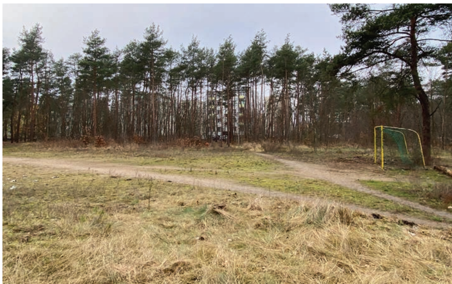
//W miejscu tzw. „żwirówki” powstanie nowoczesny obiekt sportowy.

W miejscu, gdzie przez ponad 35 lat wielu mieszkańców Otwocka grało w piłkę, powstanie nowoczesny orlik