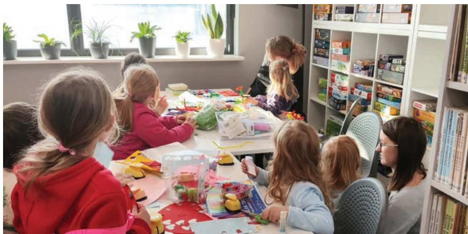
// Warsztaty dla dzieci w filii nr 7 przy ul. Warszawskiej 11/13 organizowane z okazji Dnia Babci i Dziadka.