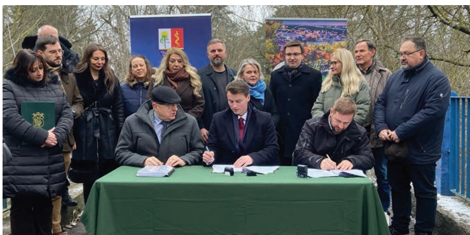
// Umowa na remont zabytkowej przeprawy została podpisana na moście łączącym Otwock i Józefów.

prześciern pod mostem, w tym usunie sztuczne przetamowania, oczyści koryto rzeki z drzew i krzewów, a także wykona nowe schody prowadzące na most.