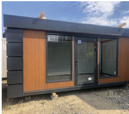
// Tak może wyglądać przykładowy kontener magazynowo-handlowy, który będzie w hali.

W ramach zagospodarowania terenu zaplanowano miejsca parkingowe dla klientów, a lokalizacja hali – w sąsiedztwie infrastruktury kolejowej i komunikacji miejskiej – zapewni dogodny