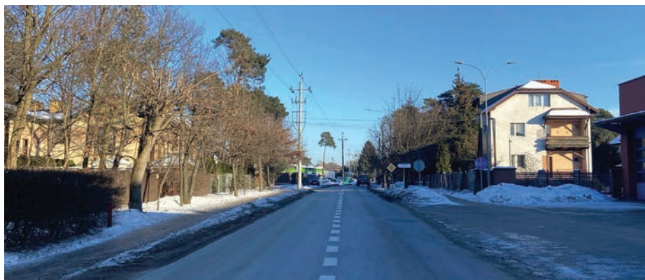
// Ulice Mieszka I, Portowa i Rycerska zostaną w tym roku zmodernizowane.