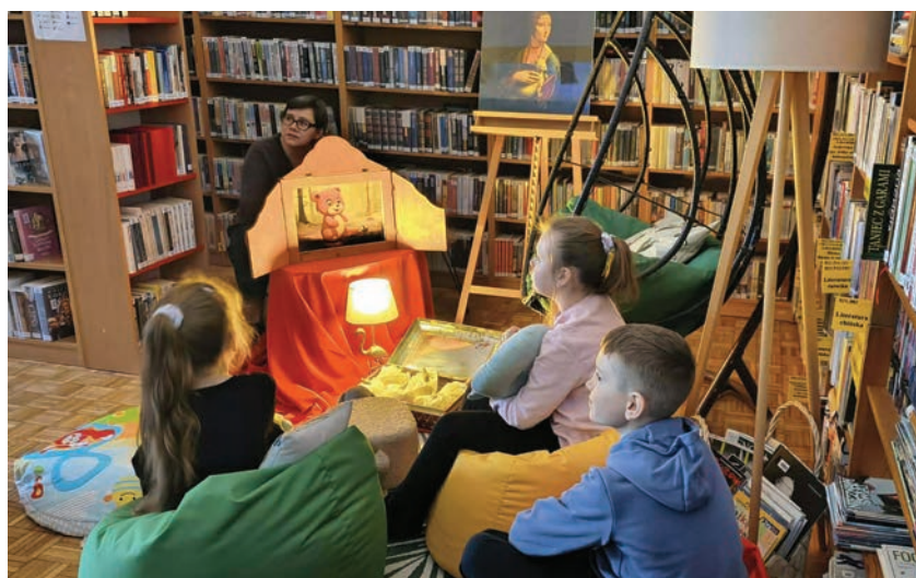
// „Poranek w bibliotece” w filii nr 6 przy ul. Matejki 9, gdzie zawiąta dla dzieci w czasie ferii teatrzyk Kamishibai.