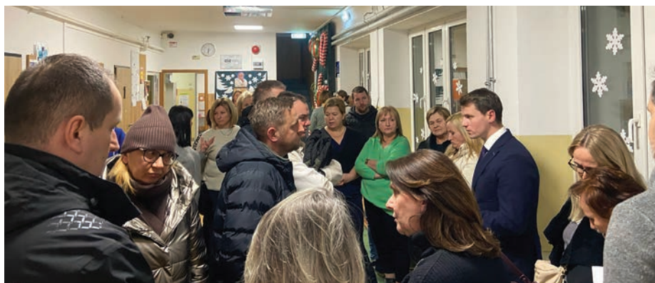
// Rozmowy z rodzicami uczniów z SP nr 9 trwały jeszcze po zakończeniu oficjalnej części spotkania.

oświatowym – za pomocą uchwał rady miasta. Podczas sesji 4 lutego radni podjęli uchwałę w sprawie zamiaru „likwidacji” szkoły podstawowej nr 9 i zamiaru utworzenia szkoły filialnej im. Jana Pawła II powstałej w wyniku przekształcenia Szkoły Podstawowej nr 2 im. Ireny Siedlerowej, która będzie posiadać placówkę filialną.