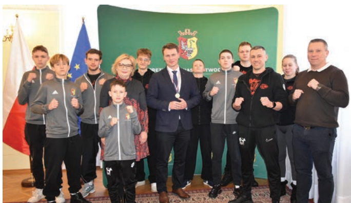
// Klub Otwock „KO” Team razem z prezydentem i radnymi.

Jak zaznaczył prezydent, decyzja o doposażeniu młodych sportowców została podjęta wspólnie z Radą Miasta Otwocka, aby zawodnicy reprezentujący miasto mieli odpowiednie wyposażenie, które sprzyja zarówno osiągnięciu wyników, jak i budowaniu zespołowej tożsamości.