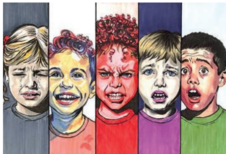
// Nagrodzona praca uczennicy z SP nr 3.

Uroczystość otworzyła wicemarszałek Sejmu Monika Wielichowska, która pogratulowała laureatom