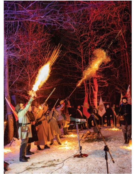
// Uroczystości z okazji 163. rocznicy wybuchu Powstania Styczniowego w Otwocku przy mogile powstańczej.