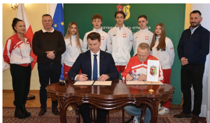
// Akademia Sztuk Walki Jissenkan Otwock razem z prezydentem i radnymi.