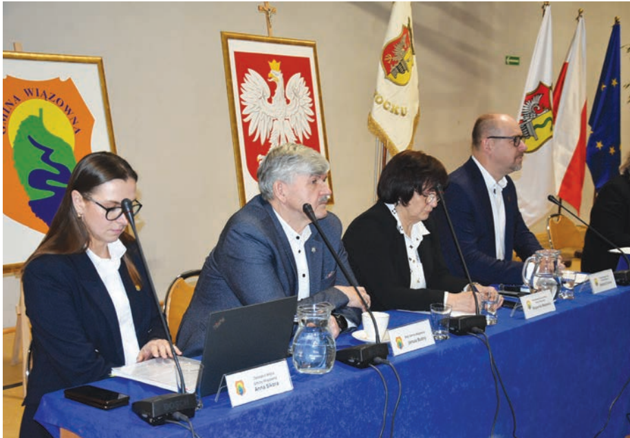
// Władze gminy Wiązowna.

jedyna skuteczna droga do ochrony interesów mieszkańców i środowiska.