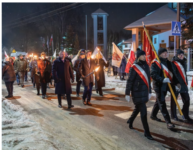
// Poczty sztandarowe zgromadzone przed kościołem podczas uroczystych obchodów rocznicy wybuchu Powstania Styczniowego.