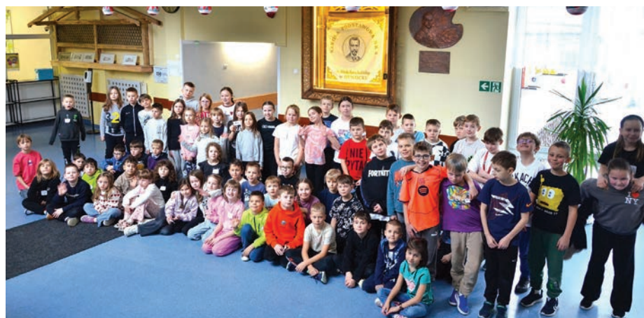
// Uczestnicy miejskich półkolonii w szkole podstawowej nr 6.

Organizatorami zimowego wypoczynku było miasto i Oświata Miejska w Otwocku. Dziękujemy dzieciom za wspólnie spędzony czas i wspaniałą atmosferę podczas ferii zimowych. ■