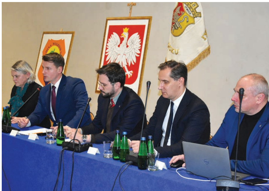
// Władze miasta Otwocka.