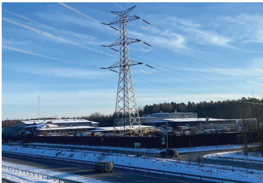
// Zakład śmieciowy przy trasie ekspresowej S17 w sąsiedztwie Otwocka i Wiązowny, przez który przechodzi linia wysokiego napięcia i gazociąg wysokiego ciśnienia, co stwarza dodatkowe zagrożenie.

Teraz kolej na Wiązownę, która powinna w najbliższym czasie uchwalić miejscowy plan dla terenów sąsiadujących z Otwockiem.