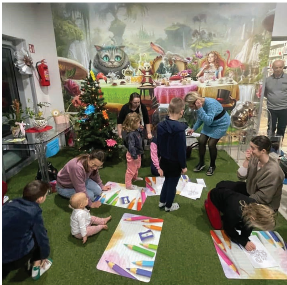
// Kreatywne ferie w filia nr 4 przy ul. Żeromskiego 235, gdzie pracownicy biblioteki zorganizowali „Rodzinne spotkanie czytelnicze”.

– Te statystyki nabierają szczególnego znaczenia, gdy spojrzymy na nie przez pryzmat historii. Rok 2026 jest dla Miejskiej Biblioteki Publicznej w Otwocku rokiem jubileuszowym. Kończymy 80 lat. Osiem dekad nieprzerwanej działalności to dowód, zaufania i silnego zakorzenienia biblio-